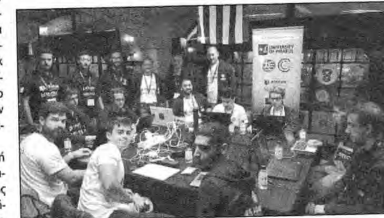
Ο μαθητής του 1ου ΕΠΑΛ Ηρακλείου συμμετείχε στην ελληνική αποστολή, που κατέκτησε την πέμπτη θέση στο διαγωνισμό για την κυβερνοασφάλεια

Σε επαγγελματικό επίπεδο, θα ήθελε να ανοίξει μία εταιρεία με αυτό