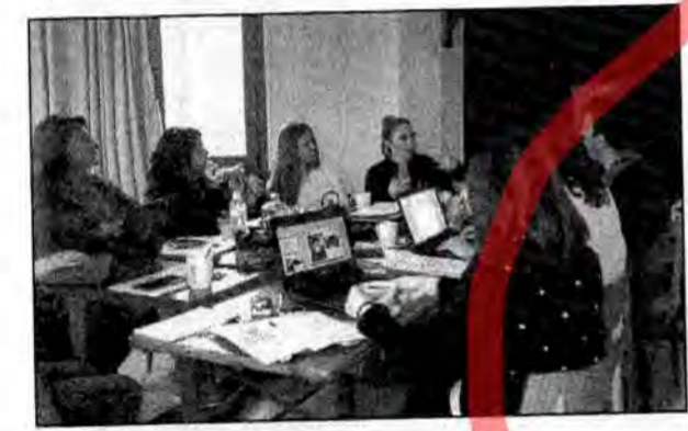
Από τη συνάντηση